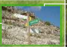
Itinerario de senderismo señalizado. Signaled trekking town trail.